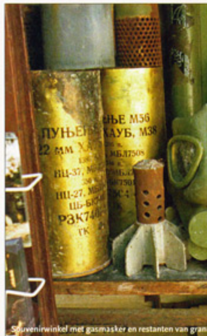
Souvenirwinkel met gasmasker en restanten van granaten